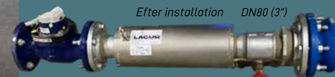
Efter installation DN80 (3")